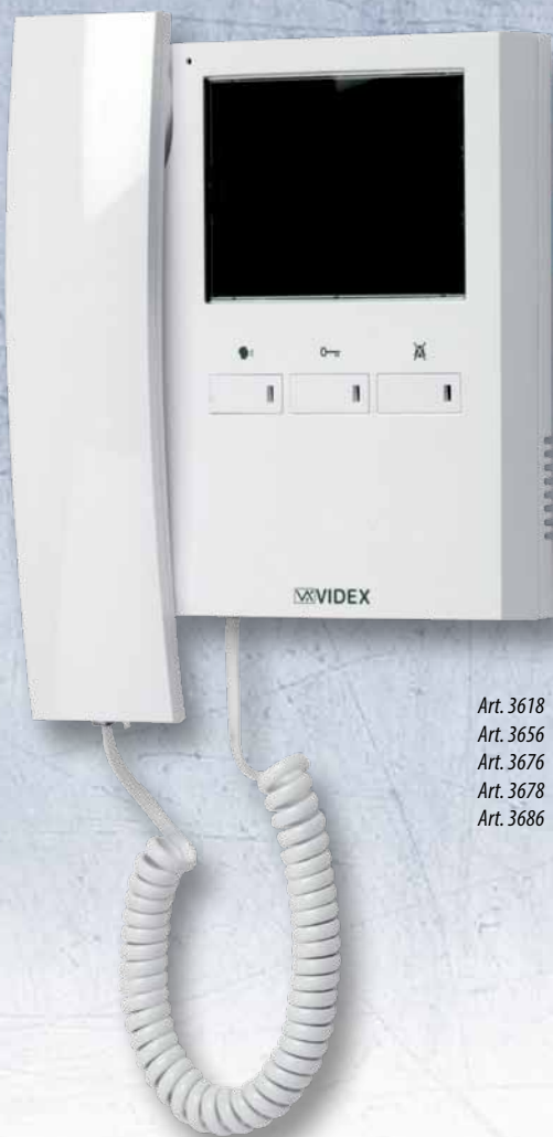
Art. 3618 Art. 3656 Art. 3676 Art. 3678 Art. 3686