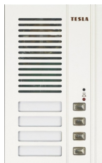
Modul EV4 - 4FN 230 14 - 4 vyzváněcí tlačítka - trvalý podsvit bez konektoru (nelze pro výstavbu tabla)