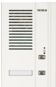
Modul EV1 - 4FN 230 11 - 1 vyzváněcí tlačítko - tlačítko pro podsvit