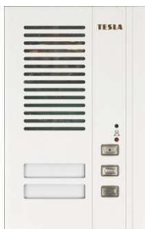
Modul EV2 - 4FN 230 12 - 2 vyzváněcí tlačítka - tlačítko pro podsvit