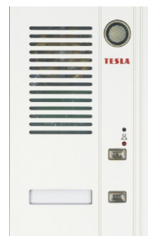
EV s dotykovou plochou (bez OPJ) EV1 - 4FN 230 41 EV2 - 4FN 230 42 EV4 - 4FN 230 44