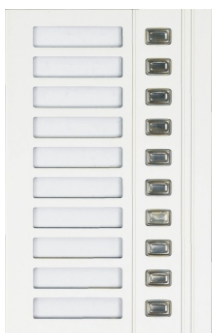
Modul TT10 - 4FN 230 20 tlačítkový panel - 10 vyzváněcích tlačítek