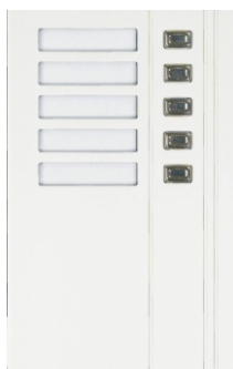
Modul TT5 - 4FN 230 15 tlačítkový panel - 5 vyzváněcích tlačítek