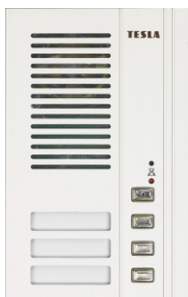
Modul EV3 - 4FN 230 13 - 3 vyzváněcí tlačítka - tlačítko pro podsvit