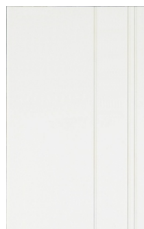
Záslepka - 4FA 691 89 pro zaslepení místa v montážní desce