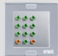
1148/46 + 1148/61