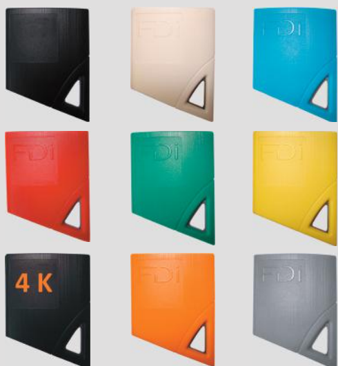
FD-010 barevné varianty