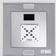
1148/45 + 1148/61