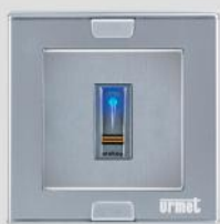
1106/2 + 1148/61